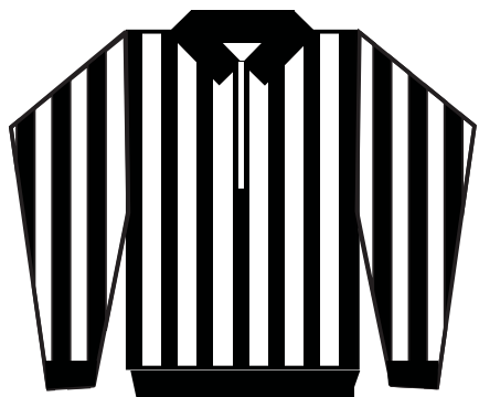
Chandail pour juge de lignes