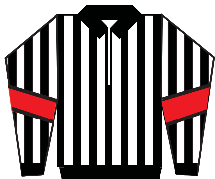
Chandail pour arbitre avec brassards cousus